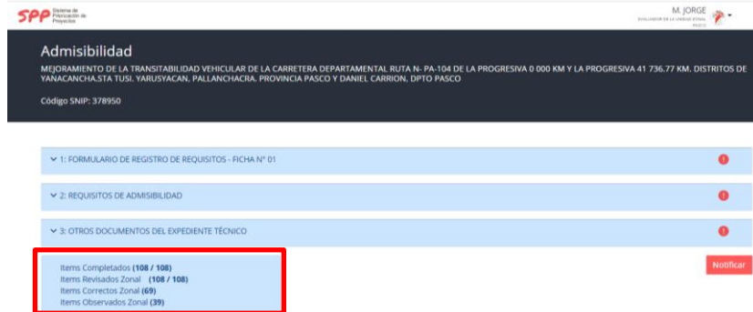
Imagen n.º 03: Tercera revisión de la etapa de Admisibilidad del proyecto de inversión: Mejoramiento de la transitabilidad vehicular de la carretera departamental Ruta PA-104 de la progresiva 0 000 km y la progresiva 41 736.77 km. Cui n.º 378950. Admisibilidad Observada